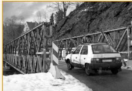
Tento zapůjčený most by měl být do konce roku 2007 nahrazen otočným mostem - prvním v ČR.

Povodní stržený most u českokrumlovského pivovaru má nahradit otočný most, který se při velké vodě otevře ve 2 částech po a proti směru proudu. Jedná se o stavbu dosud v České republice nerealizovanou, která je vyčíslená na 52,955 mil. Kč (zatím však zhruba 6 mil. Kč tvoří tzv. vyvolané investice, konkrétně pak úprava stávající trasy splaškové kanalizace). Kvůli loňskému nedostatku finančních prostředků Ministerstva pro místní rozvoj ČR na likvidaci povodňových škod, nebylo možné začít podle plánu v loni v srpnu s jeho stavbou. Vláda v loňském roce schválila všem postiženým obcím a městům, tedy i Č. Krumlovu prodloužení zápůjčky provizorního mostu z fondu státních hmotných rezerv o tři roky - tzn. do 13. 10. 2008.