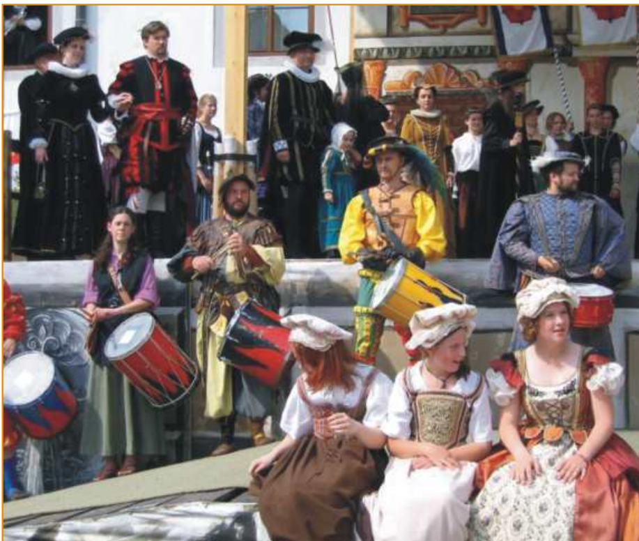
Skvělý program, krásné počasí, 25 tisíc spokojených návštěvníků - to byly 20 Slavnosti pětileté růže o minulém víkendu.

ročník 3. červen 2006 náklad 6 100 ks ZDARMA