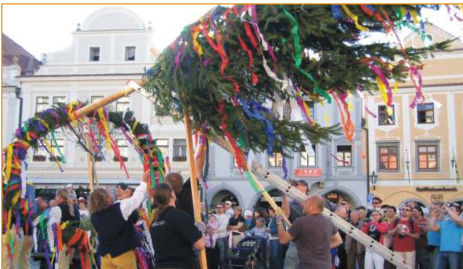
Poprvé náměstí Svornosti zdobí májka, vztyčená 30. dubna při podařeném Koulném Krumlovu. Příponou ho fotografie na straně 4.

ročník 4. květen 2007 náklad 6 100 ks ZDARMA