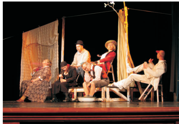
Inscenace Divadla Racek.