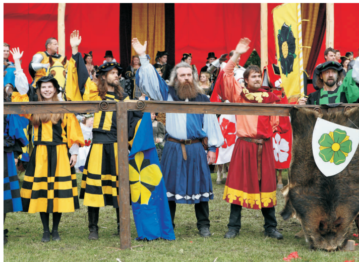
Slavnosti pětilisté růže začínají v pátek 18. června.

záboru, volné vstupenky neobdrží, ale mohou se od 14. do 18. června obrátit na paní Veroniku Malátovou na telefonním čísle 380 727 367 nebo 380 711 775 nebo osobně každý den od 8 do 16 hodin v kanceláři Městského divadla.