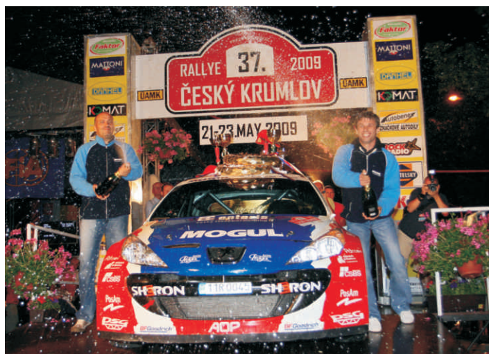
Vítězové 37. ročníku Kresta s Grossem.

Rallye Český Krumlov nedoznala oproti minulému roku velkých změn. Zachován byl program rallye, kdy byly středa a čtvrtek soutěžním posádkám vyčleněny pro seznamovací jízdy. Administrativní a technické příjímky včetně pátečního di-